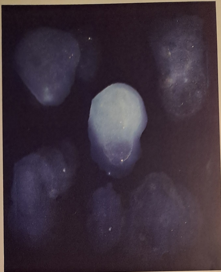
SKELETY / 2010 / akryl, plátno / 100 × 80 cm

V květnu a červnu je možné se s Háblovými obrazy setkat na výstavě Snozřivosti v Severočeské galerii výtvarného umění v Litoměřicích. Její název odkazuje k tomu, že v Háblových malbách a litografiích se čím dál více prosazuje snový automatismus, který nechává promlouvat nevědomé vrstvy osobnosti. Autor tento princip podporuje svými pokusy malovat ve tmě. Odpadá tak nejen racionální korektiv, ale především snaha estetizovat. Zůstávají jen gesta a barva. Malíř se tak vtěluje do mytické postavy slepce, která bloudila jeho mlžnými pláněmi už v polovině 90. let. Zrak se obrátil dovnitř a byl nahrazen zřením, vnější krajina se transformovala v krajinu vnitřní. ■■