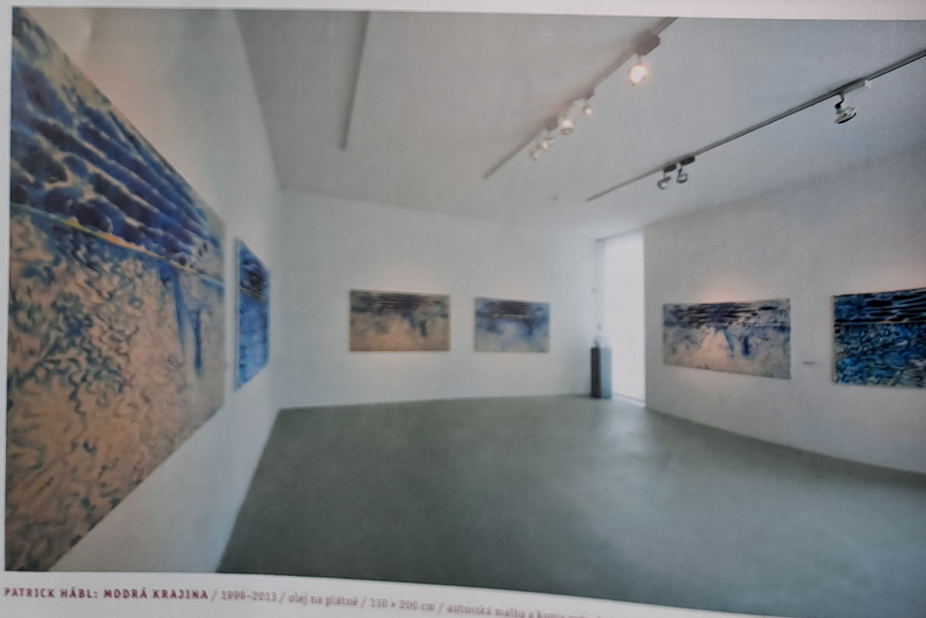
PATRICK HÁBL: MODRÁ KRAJINA / 1999–2013 / olej na plátně / 110 × 200 cm / autorská malba a kopie vytvořené malíři z různých kontinentů

Merčák pracoval také pro Jiřího Thýna nebo Dianu Winklerovou, pro kterou vytvořil zvětšeninu kovového blesku. „To byla asi moje nejnáročnější zakázka. Diana je precizní modelérka a vcítit se do její polohy nebylo snadné. Dala mi zhruba poloviční model, který jsem nemohl pouze poměrově zvětšit. Ten blesk měl v sobě zlomovitý pohyb. Bylo nutné ho zachovat. Musel jsem poměřovat spíš citem než výpočty,“ objasňuje. Vlastní uměleckou invenci do práce nezapojuje. „Viděl jsem, jak to vypadá, když řemeslníci do realizací vnášejí svoje pokusy o kreativitu, a tím to autorské dílo likvidují. Já se snažím autorství nikterak nenarušovat,“ doplňuje Merčák.