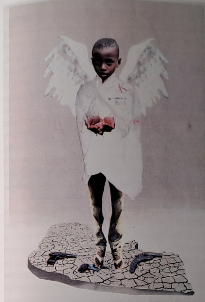
JIŘÍ DAVID: ANDĚL / 2007 / návrh a realizace v bronzu provedená Tomášem Vejdovským