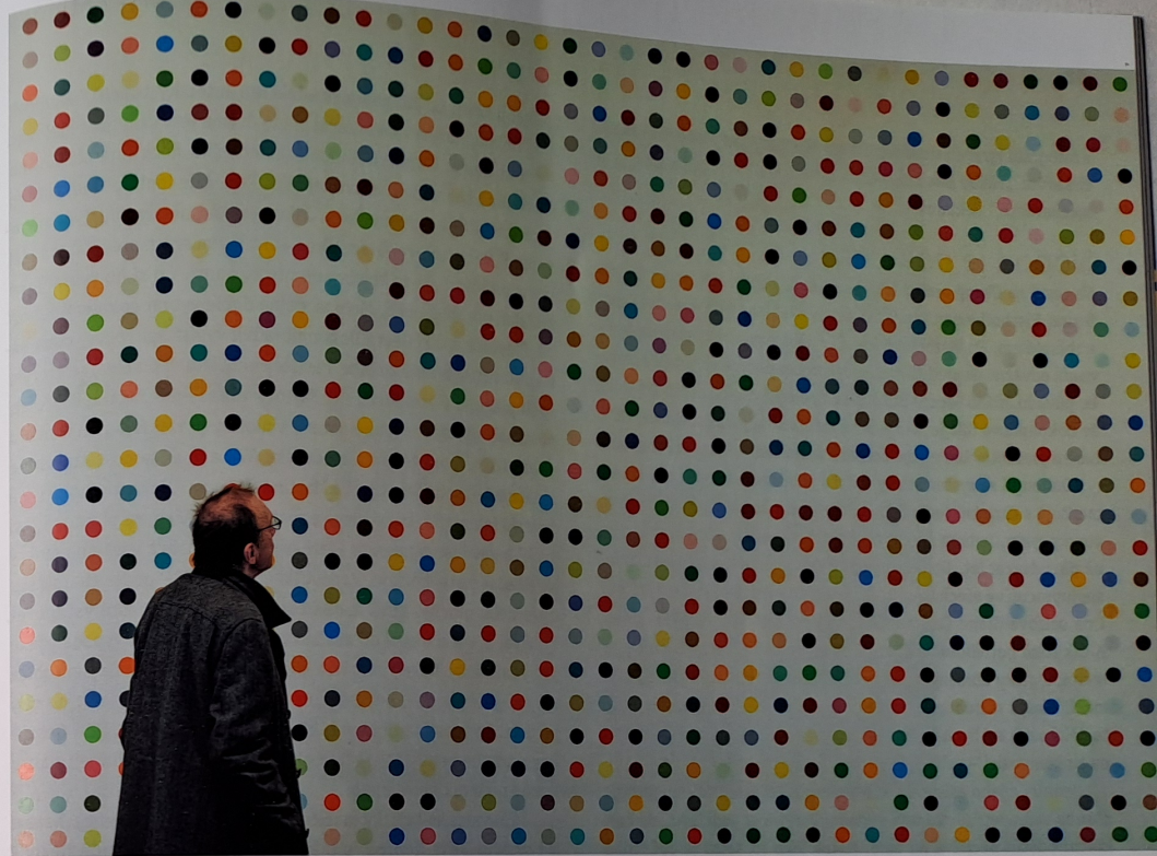
DAMIEN HIRST: UREA-13C / 2001-06 / technické barvy na plátně / 3 x 12,1 m / Návštěvník na výstavě v Gagosian Gallery v New York