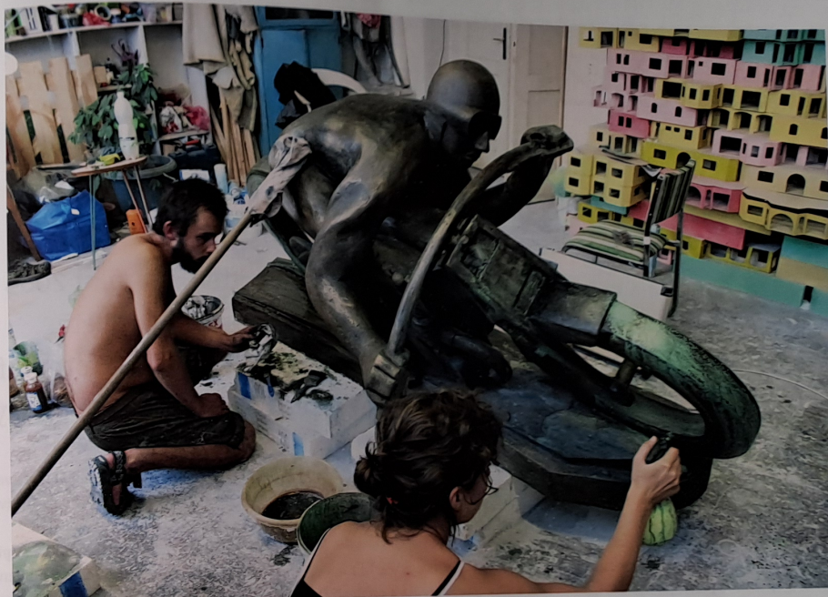
VÝROBA REPLIKY SOCHY OTAKARA ŠVECE / 2010 / určeno pro výstavu Tomáše Džadoně Závod