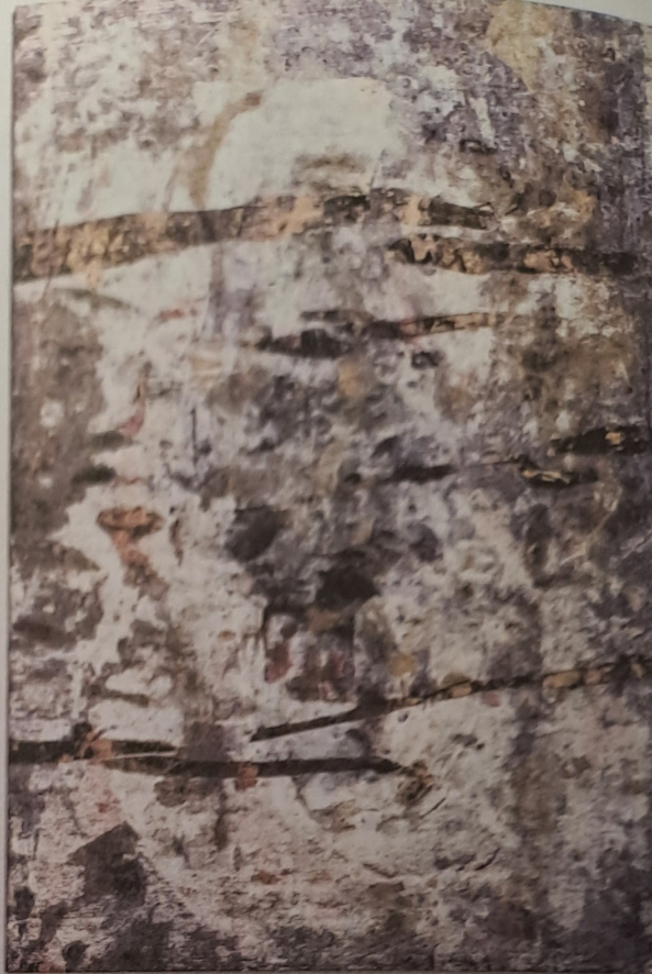
Patrik Hábl, Na hladině I+II , 2016-17, olej, akryl, plátno, 145×200 cm (diptych)

- Bílá tvář II (2015-2016), vzdáleně připomínající Turinské plátno. 5