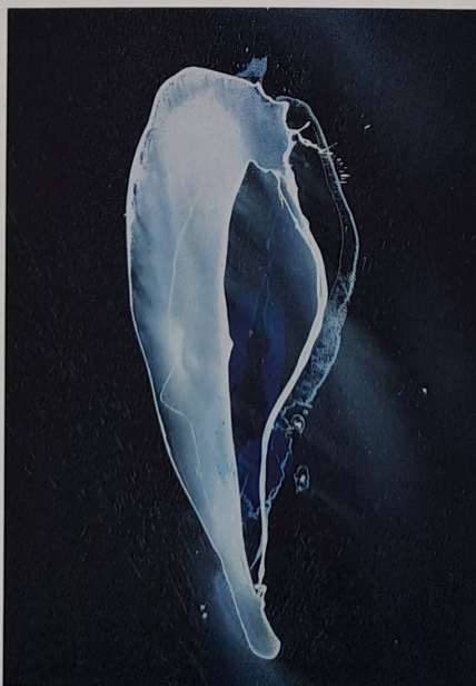
Patrik Hábl: Shell 2011, Acryl auf Leinwand

Bis 14. Juni in der Tolstoi- Bibliothek: Studioausstellung Alexander Herzen (1812 Moskau - 1870 Paris).