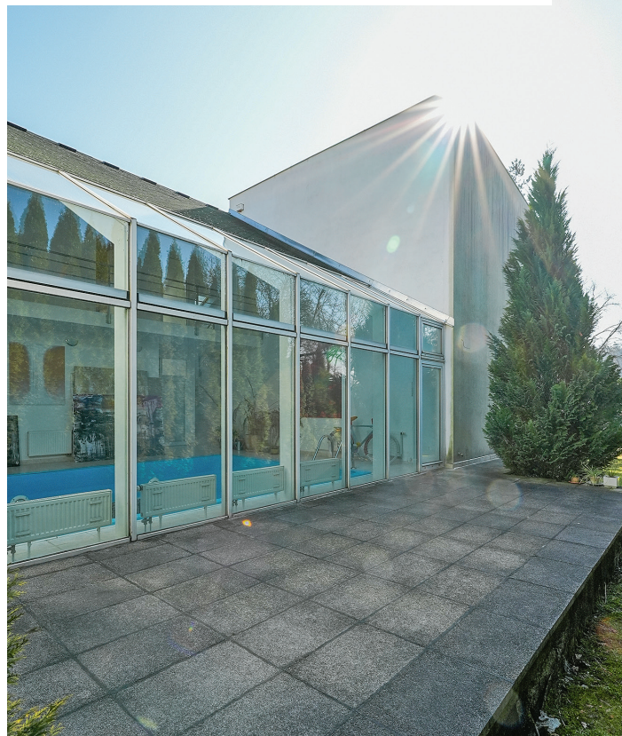
Dvě krychle spojuje vestavba s bazénem.