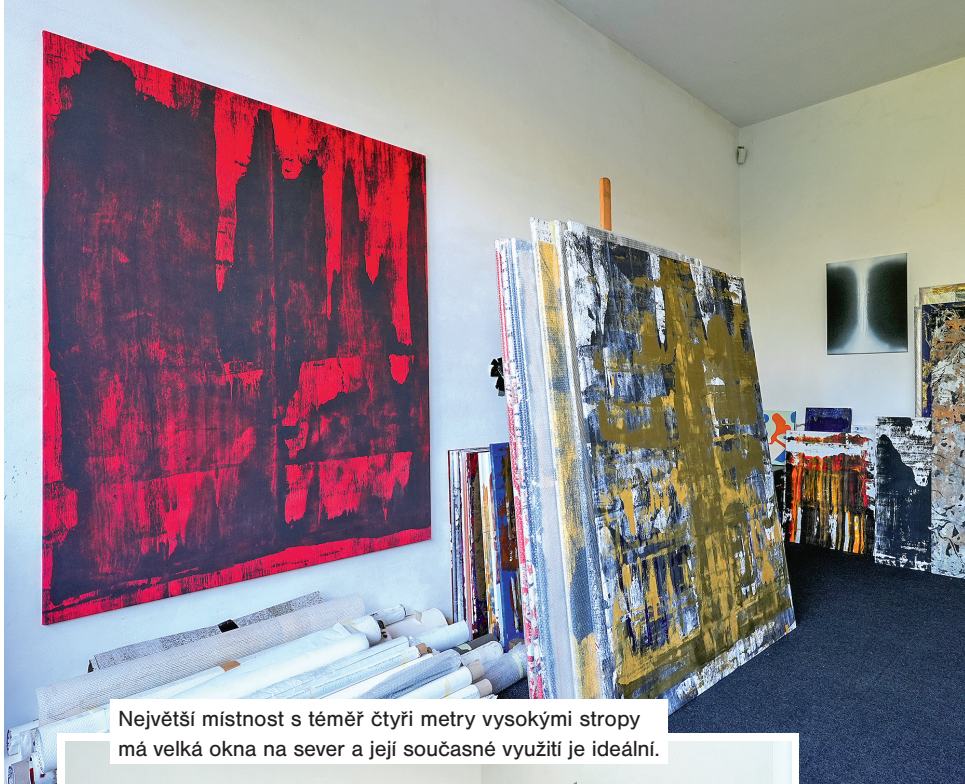
Největší místnost s téměř čtyři metry vysokými stropy má velká okna na sever a její současné využití je ideální.

Jsem hodně praktický člověk a fyzická aktivita je pro mne mimořádně důležitá. Zahrada si sama vždy řekne, co je potřeba. Až na sousedy, kteří se děsí všech těch přerostlých stromů, nejrůznějších druhů bambusů, divoké květeny a celé té na první pohled nekoordinované džungle ko-